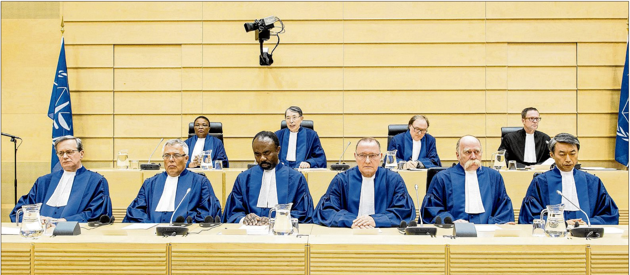
Cérémonie d'assermentation des nouveaux juges de la Cour pénale internationale, le 10 mars dernier à La Haye. Actuellement quatre juges de la CPI sont Africains.