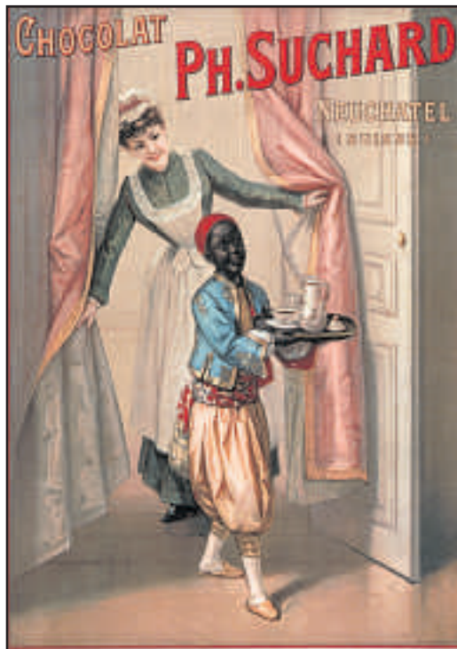
Les stéréotypes sur les Noirs étaient exploités dans la publicité et entretenus par des «exhibitions de Nègres», comme ces femmes à plateau, en 1932 au Zoo de Bâle.

succès la civilisation. De race «inférieure», l'Africain est au service du Blanc. Paresseux et voleur, il est en revanche bon musicien et danseur. Physiquement, il est fort et musclé. Les bourgeois se font de petits frissons en reluquant les Africaines dénudées, sans bousculer leur code moral.