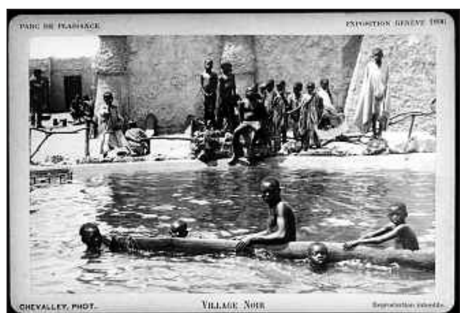
Carte postale de l'Exposition nationale suisse de 1896, montrant une scène quotidienne du «Continent noir», au Parc de plaisance de Genève.

Dès la fin du XIX e siècle, les «villages nègres» s'inscrivent aussi en contrepoint des très folkloriques «villages suisses», ces foires identitaires évoquant une Suisse bucolique en pleine période de révolution industrielle et de grands travaux dans les Alpes. Ces villages d'exhibition suisses et africains, note l'historien, permettaient de «marquer la différence» entre l'ici et l'ailleurs, entre les Suisses et les non-Suisses, entre les tribus primitives et les peuples civilisés. Les deux types de villages véhiculaient en revanche la même nostalgie pour une nature autrefois vierge et sauvage. Par leur exotisme, les «villages nègres» répondaient idéalement à ce rêve impossible de paradis terrestre... le paradis perdu. PFFY